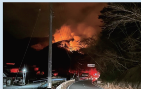
大船渡市合足地区の状況 （大船渡市林野火災を踏まえた消防防災対策のあり方に関する検討会報告書より）