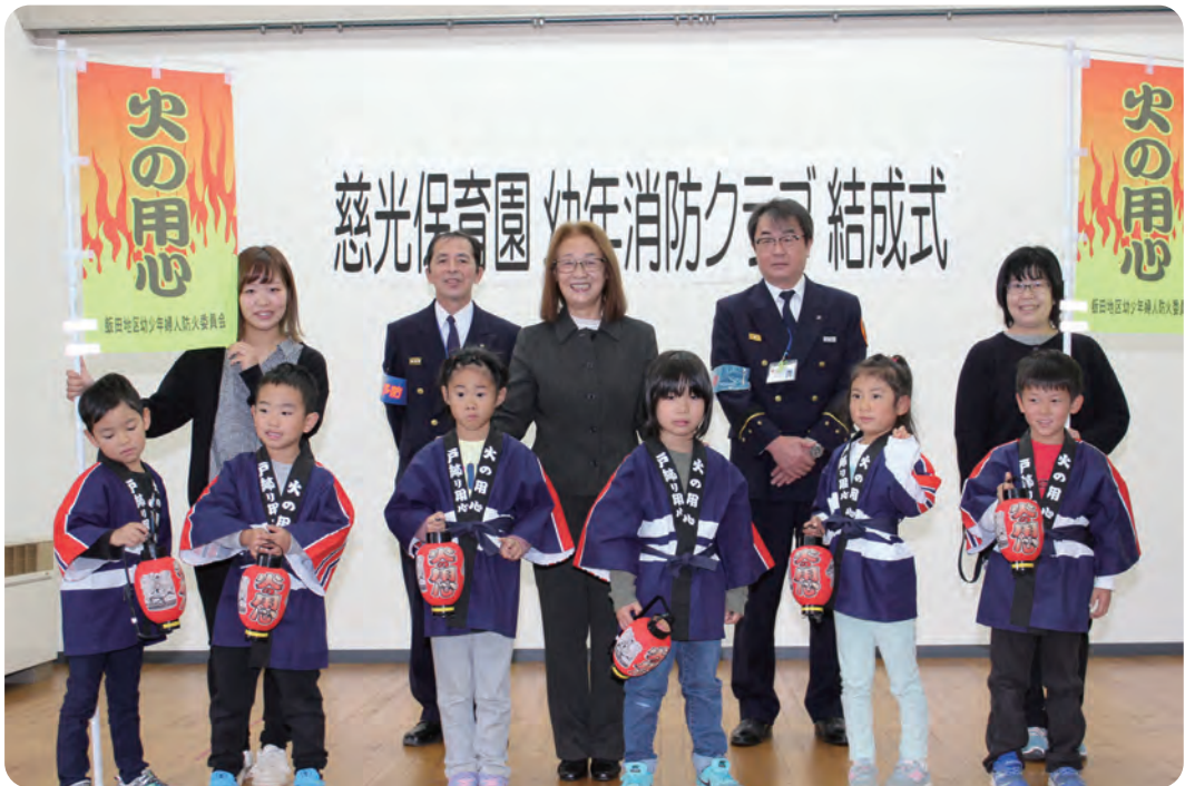
慈光保育園幼年消防クラブ 結成式 令和3年11月10日(水)