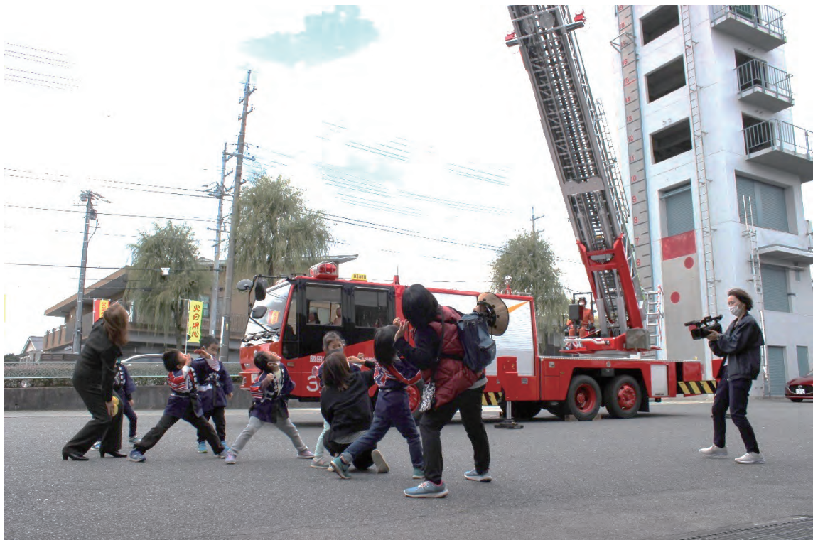
幼年消防クラブ 消防署見学