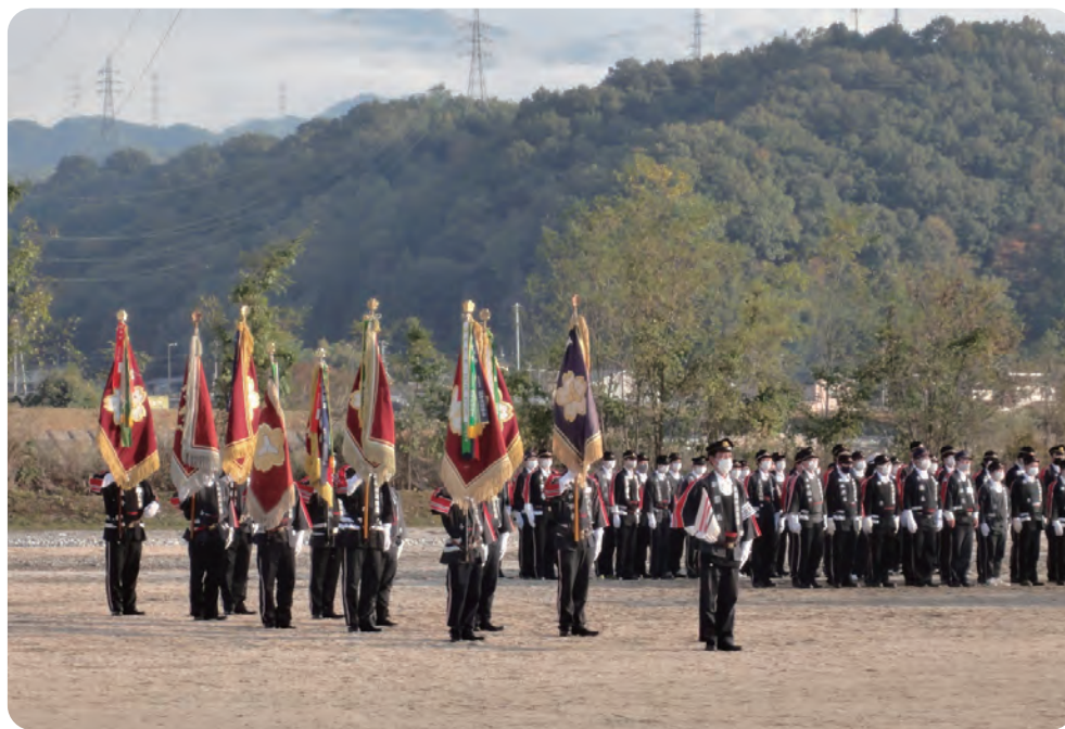
幹部基礎強化訓練 令和3年10月31日(日)