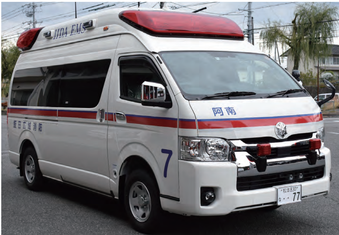
阿南救急7号車（令和3年11月1日運用開始）