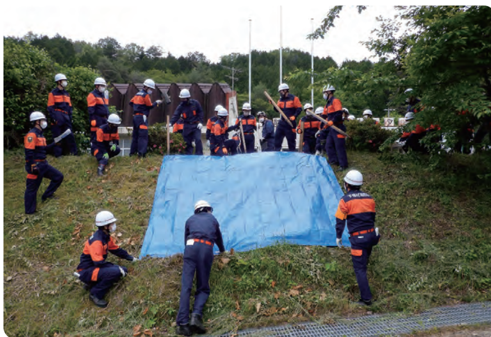
下條村消防団 土砂災害水防訓練 令和3年6月6日(日)