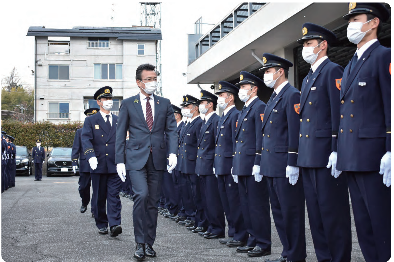
令和4年 仕事始め式（通常点検）