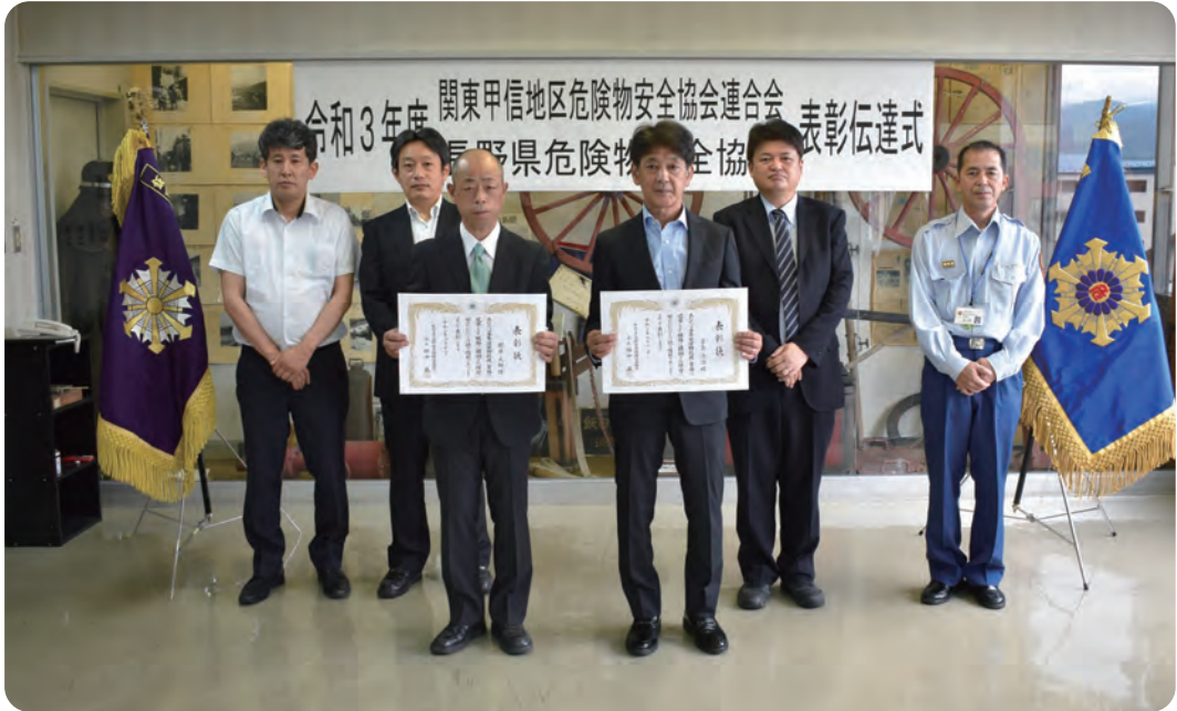
南信州危険物安全協会 表彰伝達式 令和3年7月14日(水)