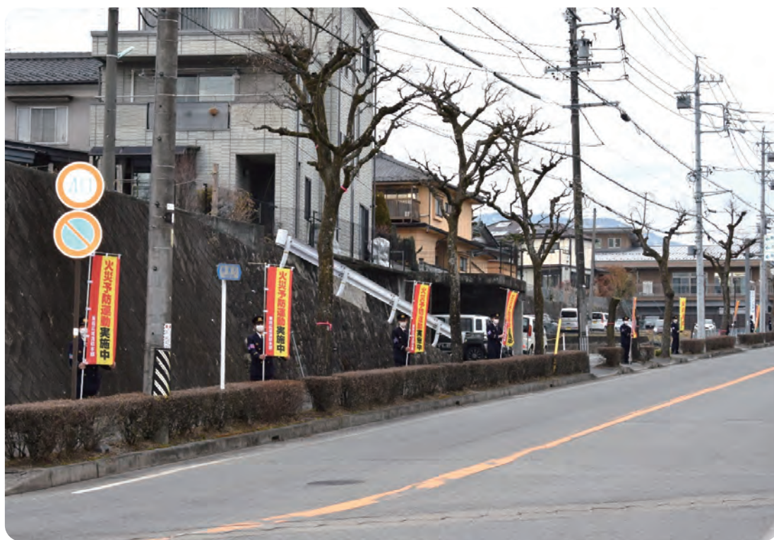
令和4年 春の火災予防運動 人波作戦