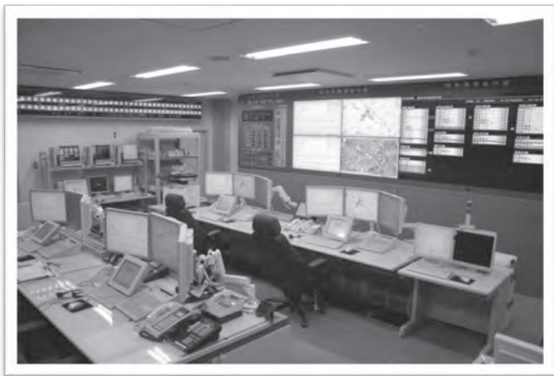
高機能消防指令システム