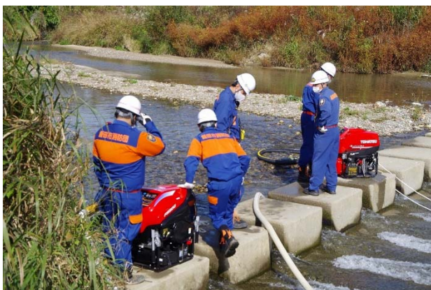
元ポンプ (消防団小型ポンプ2台)