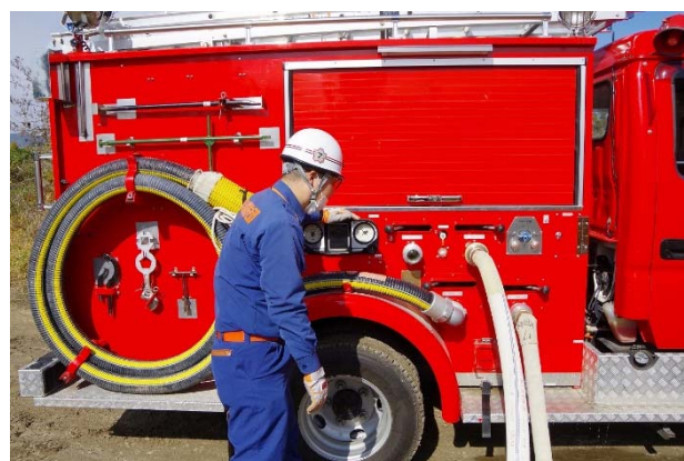
中ポンプ (消防団ポンプ車1台)