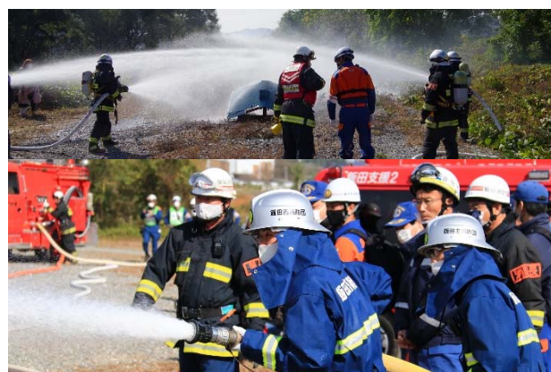
筒先 (署2線・団1線) I方向攻撃、他方向警戒