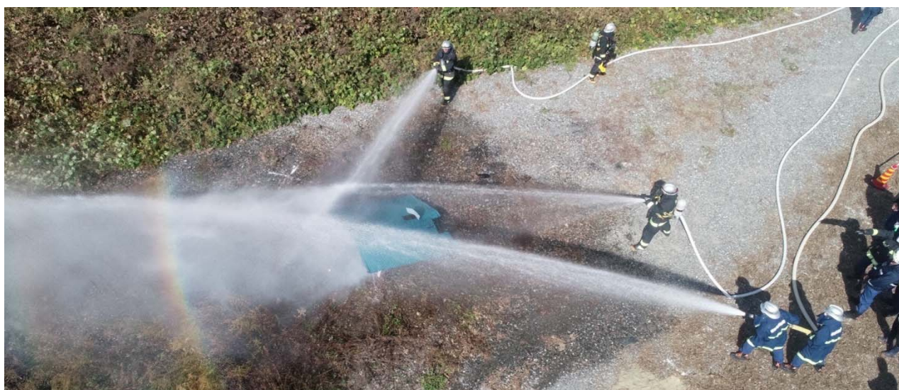
筒先 (署2線・団1線) I方向攻撃、他方向警戒