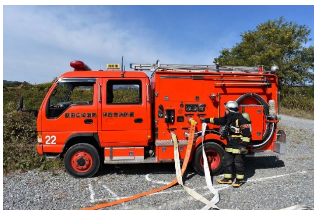
先ポンプ (署ポンプ車1台)